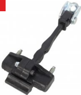
Oe Ref: 9809434280 DOOR CHECK STRAP DS7 CROSSBACK ( 2017- ) REAR RIGHT , REAR LEFT