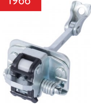
Oe Ref: 9181Q8 DOOR CHECK STRAP DS3 ( 2010 - 2016 ) FRONT RIGHT , FRONT LEFT