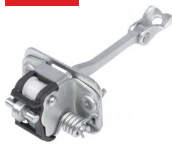
Oe Ref: 9181R2 DOOR CHECK STRAP DS4 ( 2010 - 2017 ) REAR RIGHT , REAR LEFT