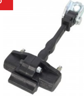
Oe Ref: 9809426680 DOOR CHECK STRAP DS7 CROSSBACK ( 2017- ) FRONT RIGHT , FRONT LEFT