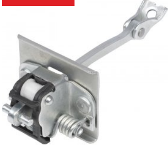
Oe Ref: 9181R1 DOOR CHECK STRAP DS4 ( 2010 - 2017 ) FRONT RIGHT , FRONT LEFT