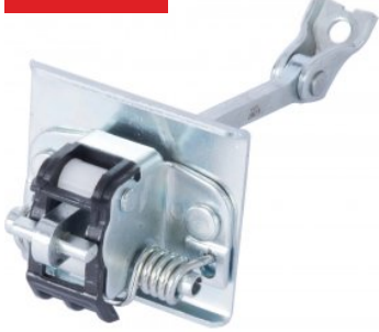
Oe Ref: 9670813380 DOOR CHECK STRAP DS5 ( 2012 - 2015 ) FRONT RIGHT , FRONT LEFT